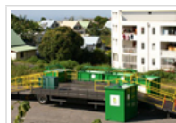
Moving'Tri, la déchèterie mobile